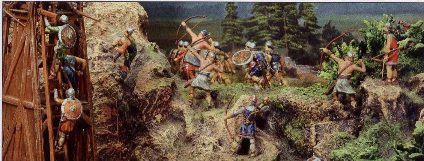
Gestaltungsvorschlag □ Suggestion for arrangement